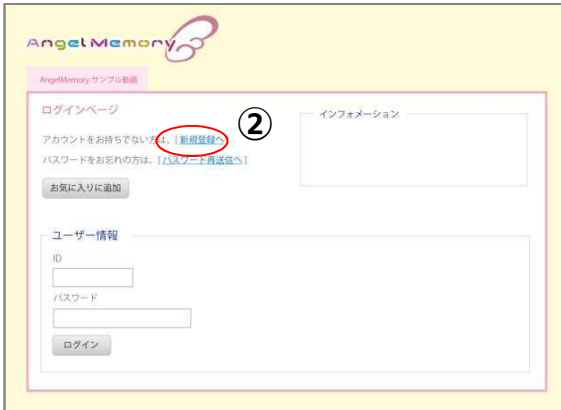
(ログイン画面イメージ)