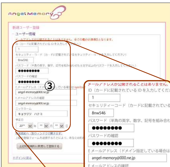
(入力後画面イメージ)